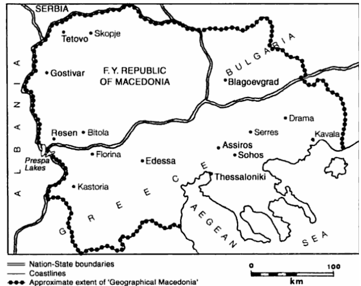
Figure 3 e 4: la percentuale della popolazione albanese nella Repubblica di Macedonia (fig. 3) e l'area geografica della Macedonia in relazione con gli stati della regione (fig. 4)

La contesa con la Grecia. Da quando ha proclamato l'indipendenza dalla Jugoslavia, la Macedonia ha dovuto condurre una lunga contesa diplomatica con la Grecia. Atene si oppone al riconoscimento della piccola repubblica balcanica con il nome di Repubblica di Macedonia, apparentemente per difendere il retaggio culturale ellenico e scoraggiare presunte (ma improbabili) mire espansionistiche di Skopje sulla Macedonia greca ('Macedonia' è anche il nome di una regione settentrionale della Grecia). Prendendo atto dell'atteggiamento greco molti paesi dell'Ue (tra cui l'Italia) continuano ad usare la formulazione provvisoria con cui la piccola repubblica ha aderito all'Onu: 'ex Repubblica Jugoslava di Macedonia', abbreviata in 'Fyrom' secondo l'acronimo in lingua inglese (former Yugoslav Republic of Macedonia).