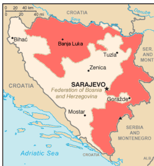
Figura 1: le entità della BiH: Federazione musulmano-croata e Republika Srpska (in rosso).

I partiti bosgnacchi vedono di buon occhio un incremento delle prerogative delle istituzioni centrali dello stato, una prospettiva gradita anche agli Usa e ai principali paesi europei e considerata necessaria per l'integrazione euro-atlantica del paese. Al contrario i partiti serbi escludono qualsiasi riforma che preveda l'abolizione della Republika Srpska o un forte ridimensionamento delle sue competenze. Anzi, sia gli esponenti politici della Rs, sia varie associazioni e ong serbo-bosniache hanno auspicato molte volte un referendum sull'indipendenza della Rs 1 . I partiti croati si collocano in una posizione intermedia. Hanno proposto un'organizzazione territoriale basata su quattro entità territoriali, il che comporterebbe lo smembramento della Republika Srpska, ma vedono di buon occhio anche l'idea di costituire una federazione tripartita, in cui accanto alla Rs vedrebbero la luce un'entità bosgnacca e una croata, entrambe modellate su base etnica.