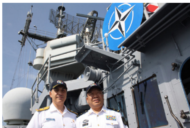
Cooperazione Cina-Nato contro la pirateria: il comandante dell'operazione Nato Ocean Shield e il suo omologo cinese si incontrano nel Golfo di Aden, a bordo della fregata turca Tcg Giresum, a inizio 2012

I fenomeni della globalizzazione e il relativo disimpegno statunitense in Medio Oriente hanno consentito a Pechino di rafforzare rapporti diplomatico-commerciali con le monarchie del Consiglio di cooperazione del Golfo (Ccg), anzitutto a tutela delle necessità energetiche interne: secondo la Energy Information Administration , nel 2014 il 26% del greggio importato dalla Cina proveniva da Arabia Saudita e Oman 3 . L'Arabia Saudita, frustrata dal riavvicinamento fra Washington e Teheran su dossier nucleare e lotta al cosiddetto califfato, guarda sempre più a est per diversificare la propria rete di partnership internazionali. Riyadh, firmataria di un