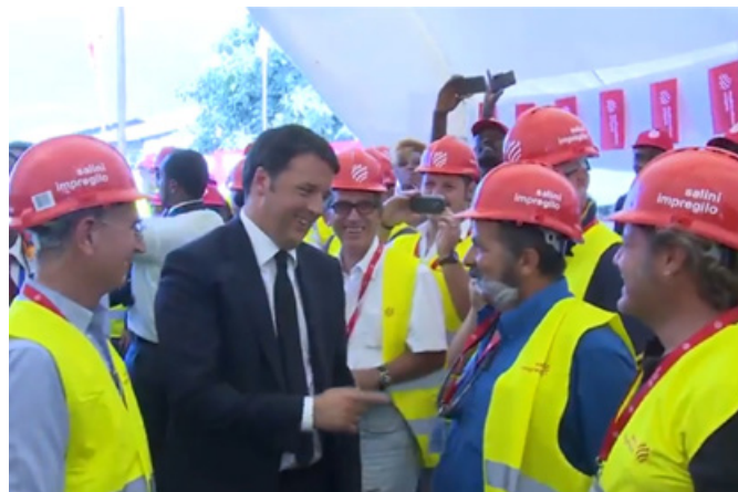
In occasione della visita ufficiale in Etiopia (luglio 2015) con tappa al cantiere di Gibe III, opera di Salini-Impregilo, il premier italiano Matteo Renzi ha fatto esplicito riferimento alla competizione con Pechino : "Sono molto orgoglioso per questa cooperazione tra due paesi. Siamo un paese fortissimo per la qualità della nostra ingegneria e come mi ha più volte ripetuto Salini battiamo i cinesi in ogni record".

Anche l'Italia, dal 2007 in avanti, ha rafforzato la propria posizione economica nel paese, nonostante permanga lo storico primato dell'Africa mediterranea rispetto all'Africa sub-sahariana quale area di destinazione preferenziale degli Ide italiani in uscita: gli Ide italiani in Etiopia sono stati pari al 5,2% del totale nel 2009, per poi calare al 3,4% nel 2012 4 . Quanto ai flussi commerciali, nel 2013 l'Italia è risultata il sesto paese esportatore per l'Etiopia (il terzo in Europa) e il decimo mercato di destinazione dell'export etiope (primo in Europa). Sebbene osservatori qualificati confermino che il potenziale margine d'impatto che l'Italia ha sul mercato etiope è piuttosto elevato, i dati mostrano come il peso specifico dell'Italia nelle relazioni commerciali dell'Etiopia sia calato vistosamente, di fatto dimezzandosi tra il 2001 (8% sul