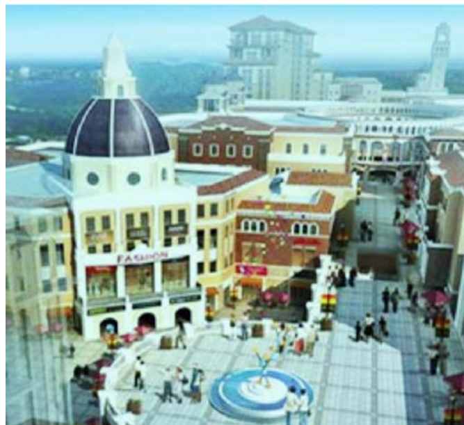
Una volta realizzata, la "Città cinese-europea" di Tonglu sarà "l'unico grande luogo commerciale, culturale e turistico della provincia dello Zhejiang a possedere il fascino e la quintessenza dell'Europa".

Visitando i contesti di origine, tuttavia, non si può non restare colpiti dalla frequenza con cui ci si imbatte in persone giovani che dichiarano di essere tornati in Cina dopo aver trascorso periodi relativamente brevi in Italia. Se nei villaggi di montagna da cui sono originariamente ripresi i flussi negli anni Ottanta e Novanta oggi si incontrano quasi solo persone anziane, veterani della migrazione che passano il tempo a giocare a carte o a mah jong ( majiang , 麻将) fino all'imbrunire, intavolando interminabili chiacchierate nei loro pittoreschi dialetti, nelle cittadine di media grandezza come Qingtian, Wencheng o Rui'an i "ritornati" sono persone di età inferiore ai trentacinque anni. In questi contesti urbani, tuttora pervasi da un certo fervore commerciale e da investimenti immobiliari che altrove nella regione stanno da tempo segnando preoccupanti bat-