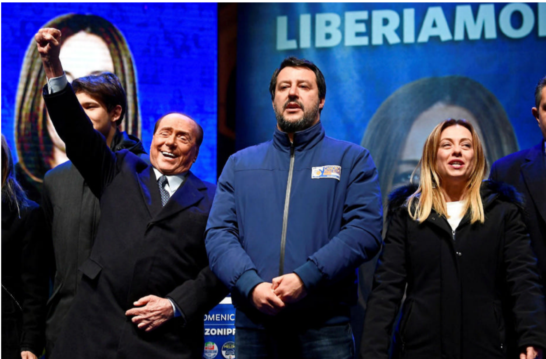
Giorgia Meloni ses her i januar 2020 med sine koalitions partnere Silvio Berlusconi (t.v.) og Matteo Salvini.

det største parti til højre for midten, står også Italien til at svinge skarpt til højre.